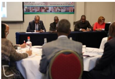
LEAD RECEF, Bruxelles, 5-8 nov. 2014

Un autre volet du projet a effectivement permis de « contribuer à la pérennisation et au renforcement des capacités de la CENI » (objectif spécifique 4) et ainsi de conforter la permanence de l'institution. Les activités prévues dans le document de projet (dotation de la CENI en mobilier et en équipement bureautiques et informatiques ; formation en renforcement des capacités de leadership) ont été effectivement mises en œuvre ; un module de formation intitulé « Leadership et gestion des conflits pour les acteurs électoraux » (LEAD) s'inscrivant dans le cadre du programme IRIS-ELECTIONS - dont la Fondation ECES est l'un des promoteurs- a été élaboré en vue de préparer chaque acteur-clé du processus électoral (CENI, Cour Constitutionnelle, forces de l'ordre, société civile, etc..) à prendre conscience et à assumer ses responsabilités dans l'organisation d'élections libres et apaisées.