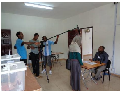
Tournage de la vidéo sur la simulation du vote

En outre ont été réalisées des vidéos - par ex. sur la simulation du vote. le vidéo clip sur la « chanson des élections » réalisé par Nextez Solutions et Interfaces prod , des compagnies locales, des reportages vidéo sur des ateliers de formation organisés par le PACTE-Comores, des micro-trottoirs, etc...- qui ont été diffusés à la télévision (ORTC), ou « postés » sur le site internet de la CENI ou sur « You Tube »... Toute la gamme des autres moyens de communication a en fait été utilisée dans cette campagne de sensibilisation : spots radio, SMS, presse écrite. Des dépliants en français,