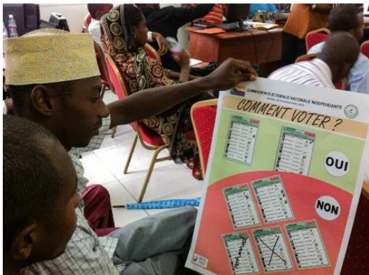
Campagne de sensibilisation animée par la CENI

La campagne de sensibilisation animée par la CENI avec l'appui du PACTE-Comores s'est inscrite en synergie avec les campagnes de sensibilisation des OSC (qui bénéficiaient d'un appui financier de la CENI, d'un montant global de 12, 6 millions de francs comoriens, cf. rapport général de la CENI sur le processus électoral, p.18) en particulier