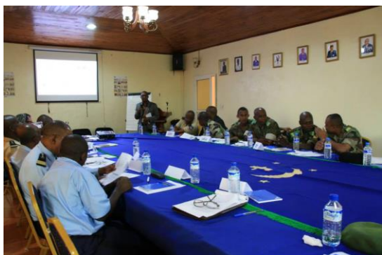
Formation des officiers et agents des forces de l'ordre, Moroni, 7 janvier 2015

PACTE-Comores a ensuite organisé cinq formations à l'intention des acteurs-clé du jour de l'élection : a) une formation a été organisée le 7 janvier 2015 à Moroni pour une trentaine de participants des forces de l'ordre (police nationale, gendarmerie et forces comoriennes de développement) afin de les préparer à la sécurisation de l'acheminement du matériel électoral ainsi que des opérations électorales ; b) et c) dans chaque île se sont tenus pendant une durée de deux jours, entre les 10 et 14 janvier 2015 une formation des formateurs des membres des bureaux de vote , ces