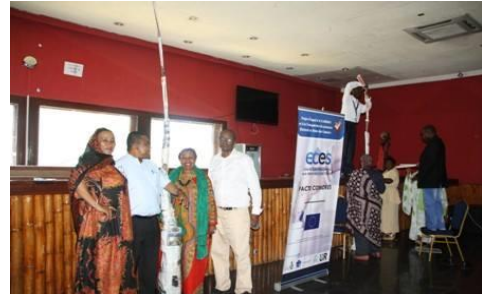
Formation LEAD, Moroni, 17-20 novembre 2014

Une seconde formation « Leadership et gestion des conflits pour les parties prenantes aux élections » (LEAD) a été organisée du 17 au 20 novembre 2014 à Moroni par le PACTE-Comores à l'intention de 35 participants représentant la CENI, la société civile, la Cour Constitutionnelle, les médias et les forces de l'ordre (cf. compte-rendu de cette activité dans le rapport intermédiaire du PACTE-Comores, pp.88-94).