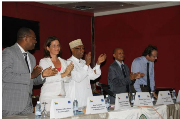
Table ronde sur le thème « Cycle électoral 2015-2016: Bilan et perspectives », Moroni, 8-9 avril 2015