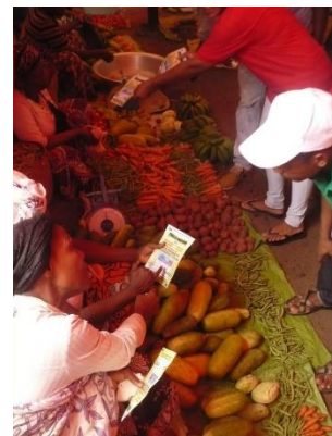
Campagne de sensibilisation – distribution des dépliants

l'OBSELEC et la FECOSC, dont les équipes ont sillonné les trois îles dans les jours précédant les scrutins de janvier et de février 2015. Les médias ont également reçu une dotation de la part de la CENI (d'un montant de 18 millions de francs comoriens) pour relayer la campagne de sensibilisation électorale. Il semble acquis que celle-ci a eu un effet positif sur la participation électorale très nettement en hausse (plus de 73%) par rapport aux scrutins antérieurs notamment la présidentielle de 2010 (52,80% des électeurs inscrits avaient voté).