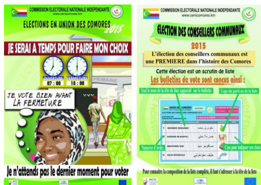
Sensibilisation dans le domaine de l'éducation civique et électorale

La CENI a eu recours aux médias audiovisuels, à la presse écrite et aux organisations de la société civile