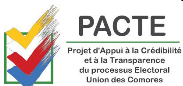
Logo du projet – PACTE Comoros

ou outils de formations (affiches, banderoles, guides, dépliants, manuels, etc.), étiquettes apposées sur le mobilier et les équipements bureautiques et informatiques, pages des sites Web de la CENI ou de la Fondation ECES hébergeant le PACTE-Comores, films etc...- reproduisent invariablement, aux côtés d'autres logos (comme ceux du PACTE-Comores et de ses partenaires) le logo de l'UE avec la mention « Ce projet est entièrement financé par l'Union Européenne ». L'évaluateur estime donc que la visibilité du projet et de l'Union Européenne a été assurée dans les meilleures conditions par l'équipe du PACTE-Comores.