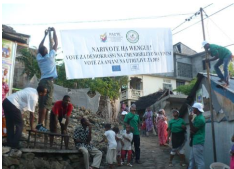
Campagne de sensibilisation, Anjouan, 7 février, 2014