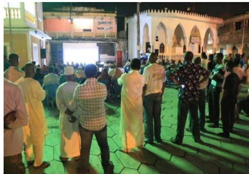
Projection du film « An African election » Moroni, 2014

Le PACTE-Comores a également largement contribué, en partenariat avec des OSC et les médias, aux efforts de la sensibilisation dans le domaine de l'éducation civique et électorale (objectif spécifique 2) en coordination étroite avec le comité de communication de la CENI, la mise en œuvre de cette action étant typique de la démarche mûrement réfléchie et participative de l'équipe du projet. Avec l'appui de l'expert en éducation civique et électorale du PACTE, un plan de campagne de sensibilisation a été élaboré, dont l'un des vecteurs a été le film « An African election » sur le scrutin présidentiel de 2008 au Ghana. Ce documentaire, qui couvre toutes les phases d'un scrutin ayant débouché sur des élections « libres et régulières » a une grande valeur didactique en mettant en évidence l'impact d'un « processus électoral bien mis en œuvre » sur « un changement pacifique du pouvoir et une continuité démocratique » (rapport intermédiaire du PACTE-Comores, p.57).