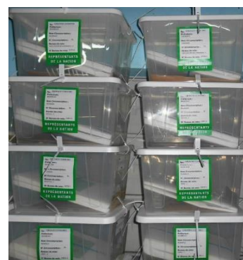
Urnes de vote (Election des Représentants de la Nation)